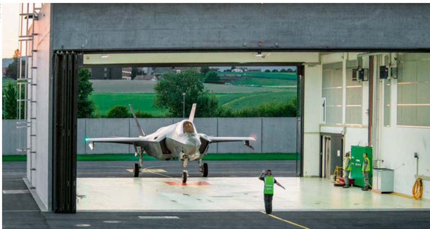
Eine F-35A der US Air Force in einer Flugzeugbox auf dem Militärflugplatz Payerne. Ein Plus der F-35 ist laut dem VBS die sehr gute Cybersicherheit.