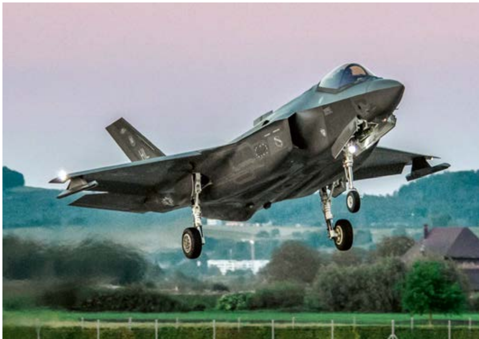
Die Stealth-Eigenschaften der F-35, hier im Anflug auf Payerne, sind anders als oft behauptet nicht nur bei Offensivmissionen, sondern auch in der Luftverteidigungsrolle ein Vorteil.